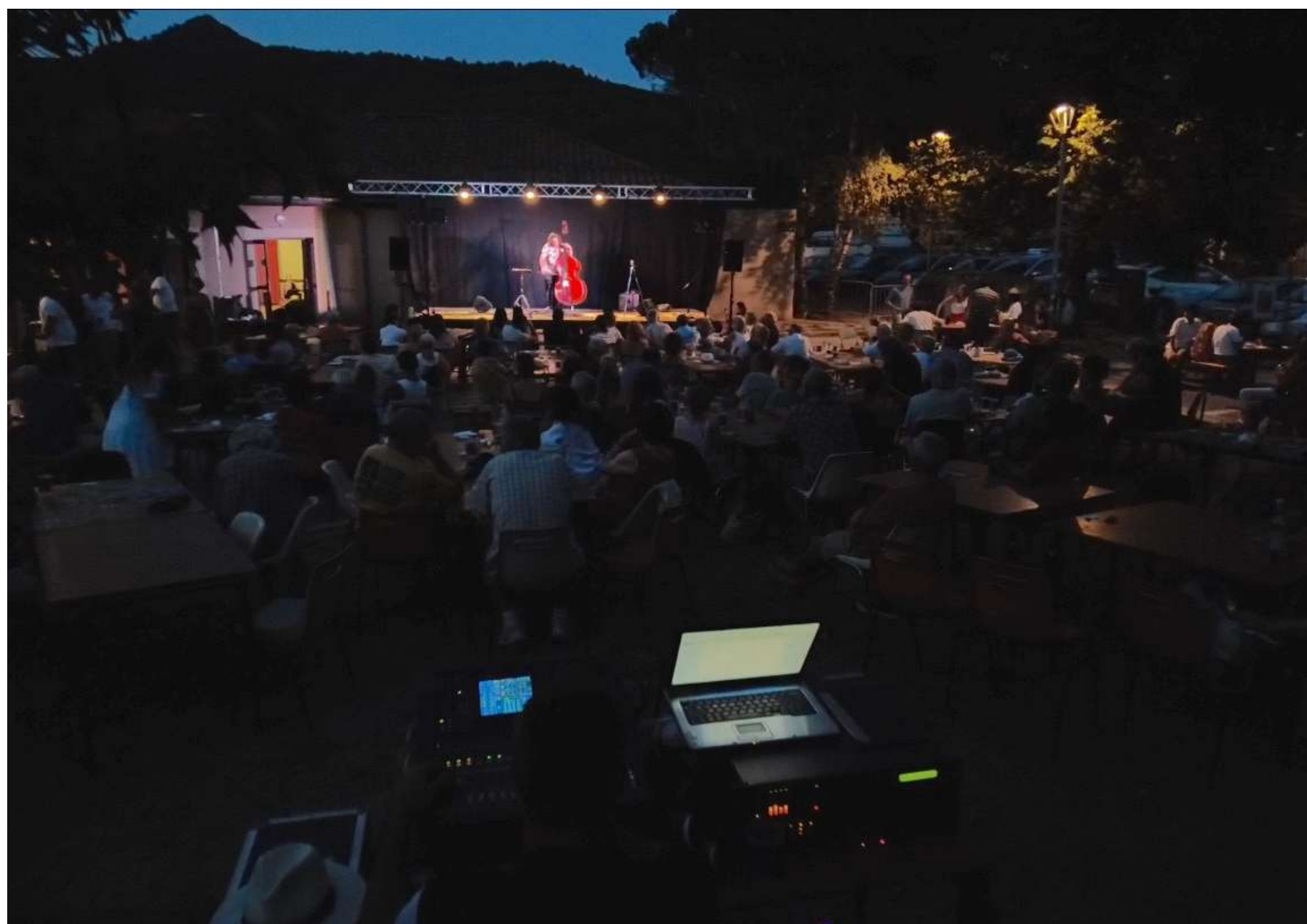
2022.08.03 Marée Basse en el festival de Jazz à Vialas (Francia)