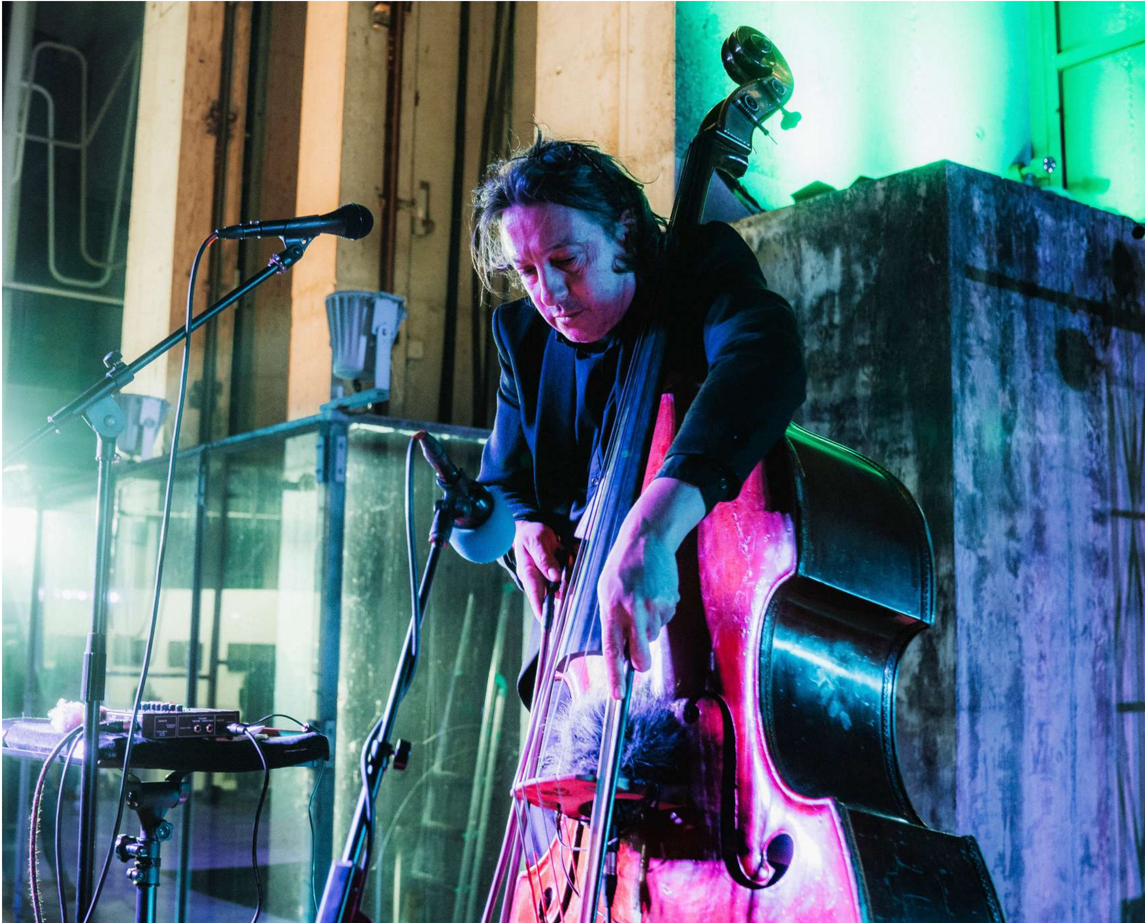
2022.12.23 Marée Basse en el Euskalduna de Bilbao